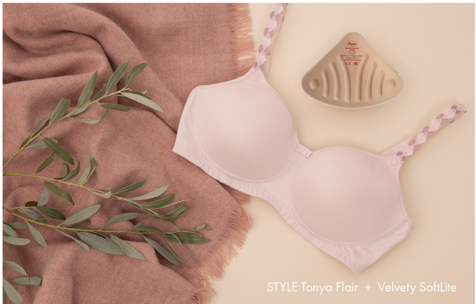
STYLE Tonya Flair + Velvety SoftLite